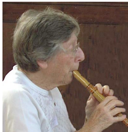
Dorking Meeting House, 2001